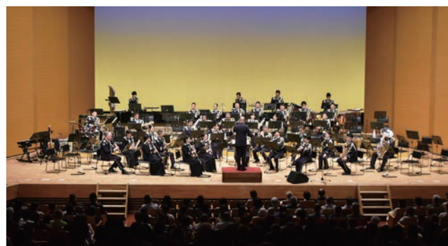
様々な楽器から繰り出される音が美しい音楽となって会場を包み込む