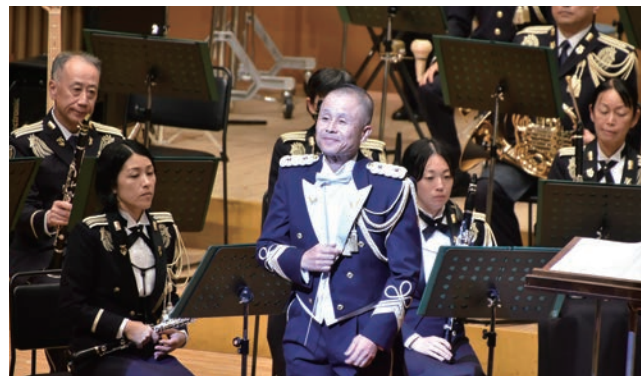
指揮の中福島第1音楽隊長

最後となりますが、陸上自衛隊第一師団の皆様、東京成徳大学高等学校と成立学園中学・高等学校の吹奏楽部関係者の皆様、王子法人会関係者の皆様などのご協力により本コンサートが開催できましたことを、この場をお借りしまして改めて感謝申し上げます、ありがとうございました！