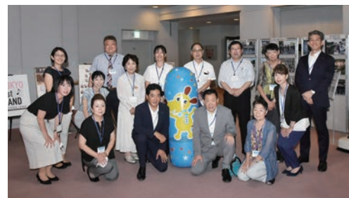
委員の皆さんで一致団結