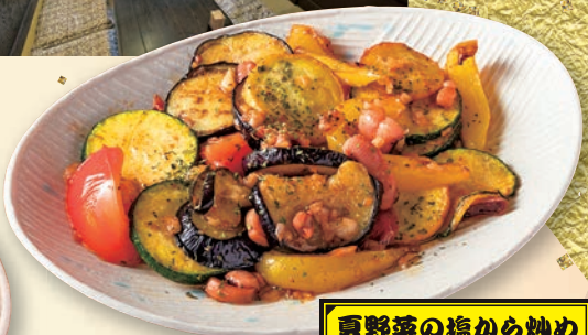
夏野菜の塩から炒め