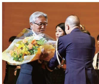
鈴木会長より花束贈呈