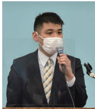
中平部会長によるお礼の挨拶