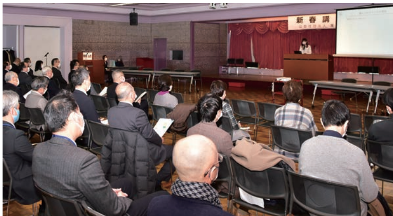
ソーシャルディスタンスを確保した会場