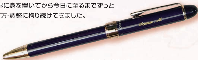
▲名入れひとつにも技術が光る

もらった人の笑顔を想像し、使用する工具を大切に仕事をしています。もらった人にとっては些細な事かもしれませんが、彫った文字の縁が「ギザギザ」としていたら、私たち職人としては一人前の仕事とは言えません。商品全体の仕上がり具合、ひいては手にした時の感動にまで影響してきます。彫りたい素材の材質によって仕上がりは大きく変わる為、業界に身を置いてから今日に至るまでずっと「刃」の研ぎ方・調整に拘り続けてきました。