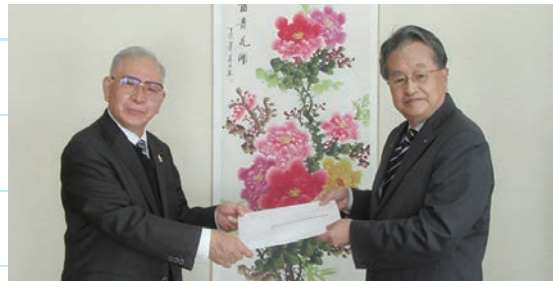
なとり北区議会議長と撮影