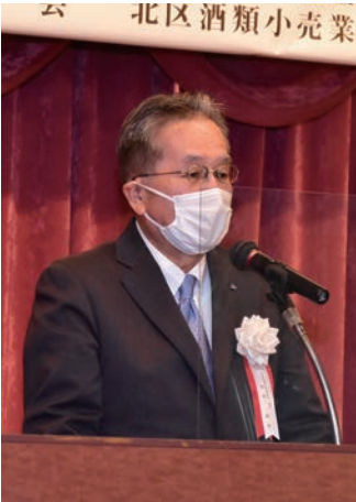
田村北区税務団体協議会会長

新年賀詞交歓会は、参加される皆様の安全を第一に考慮して、昨年同様に北区税務団体協議会と合同で規模を縮小し、参加を役員等に限定して開催致しました。