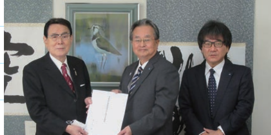
花川北区長と撮影