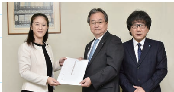
やまだ加奈子都議会議員と撮影