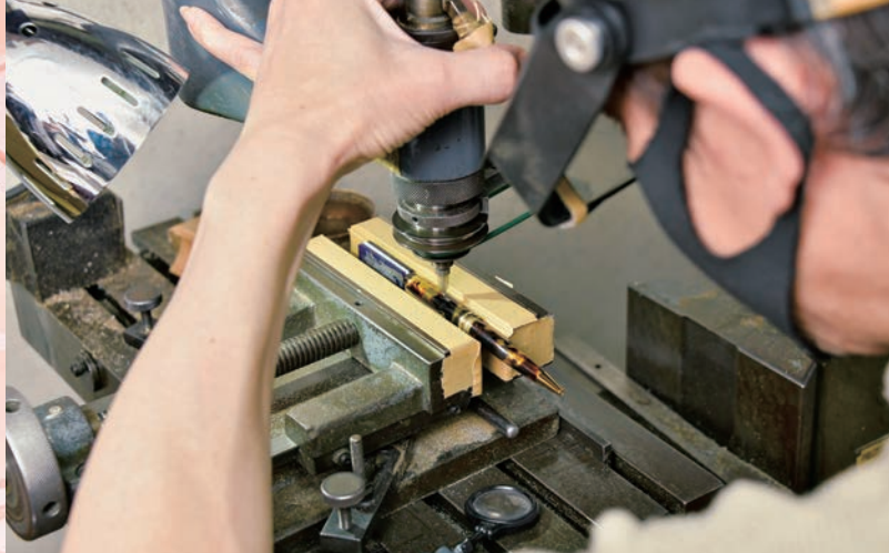
▲一点一点心を込めて。

私どもが携わせていただく商品が、ご依頼いただいた皆様の笑顔につながれば幸いです。