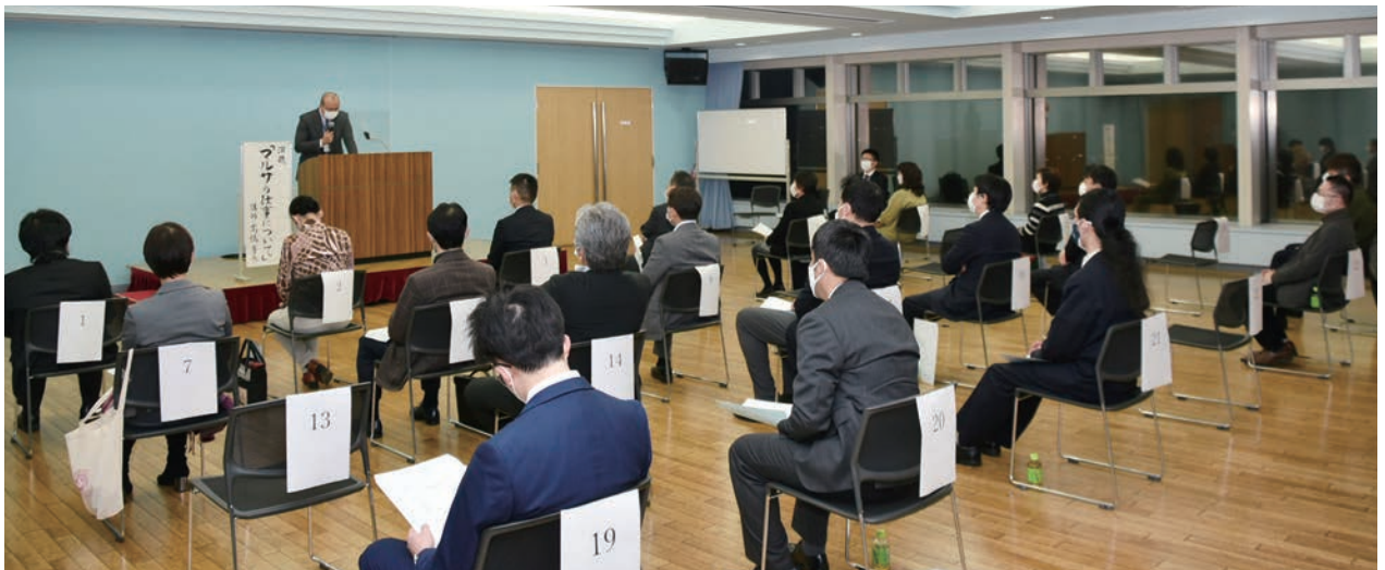
講演を聴く参加者の皆様