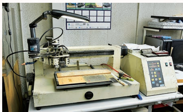
▲コンピューター彫刻機

表札、名札、看板、表彰状楯、表示置物、各種ケースなどに文字、ロゴマーク、写真、イラストを彫刻いたします。