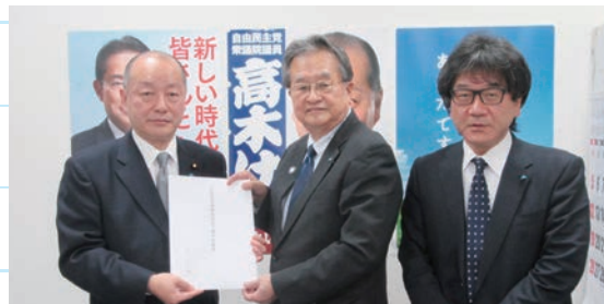
高木衆議院議員と撮影