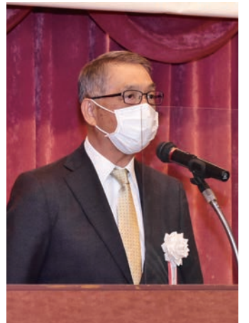
閉会は片桐王子間税会会長