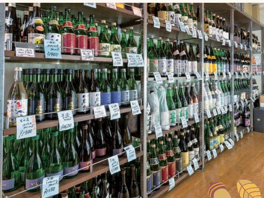
▲厳選された品揃え