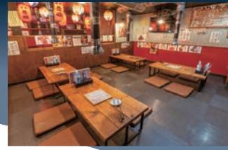
▲2階はお座敷でくつろげます。