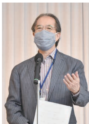
森岡先生より選考基準等の説明