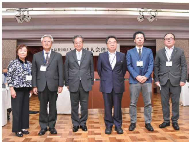
全法連功労者・東法連功労者・東法連増強功労者の皆様