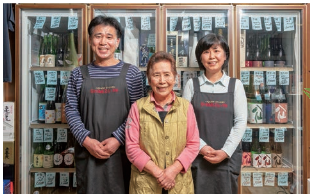
▲笑顔でお客様をお迎えます。

豊富な品揃えと、徹底した商品管理で美味しいお酒をお客様の元へ。皆様のご来店をお待ちしております。