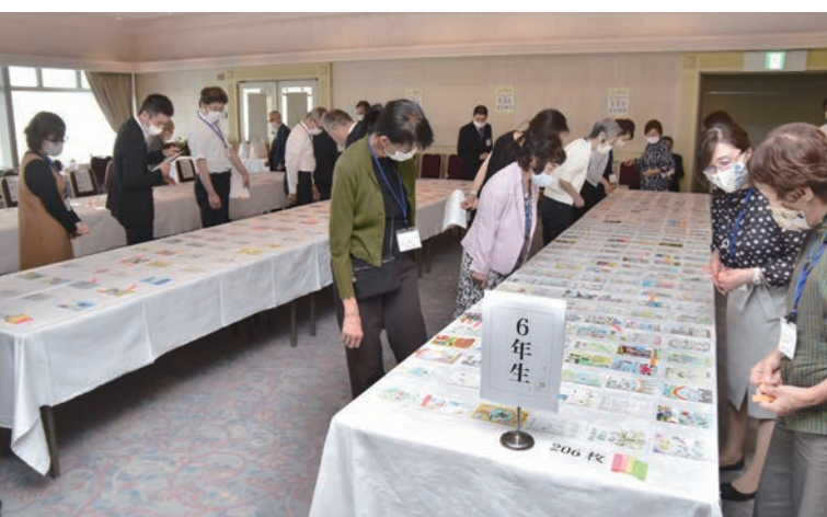
力作揃いで審査にも熱が入ります。