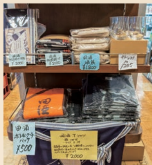
▲酒蔵グッズも大人気