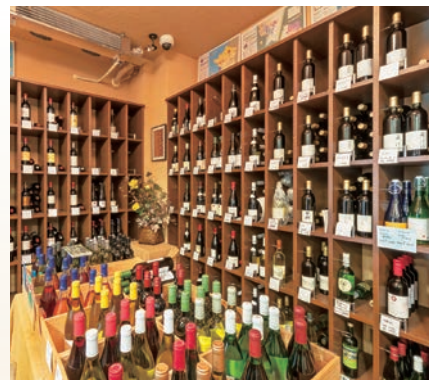
▲珍しい銘柄も揃っており、足繁く通うファンも。