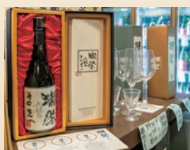
▲ギフトのご相談もお気軽にどうぞ。