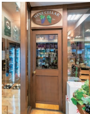
▲ワインセラー入口