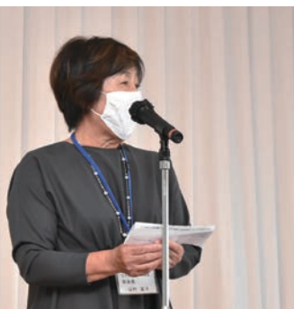
山村部会長の挨拶

最後にご協力頂きました、各校の校長先生をはじめ、副校長先生、図工の先生、担任の先生方、本当にありがとうございました。