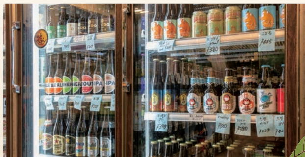
▲ラベルが鮮やかなクラフトビール