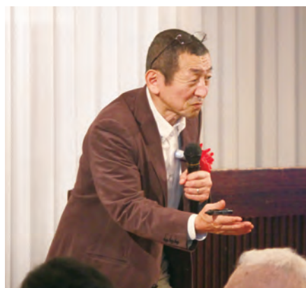
1,200回以上の講演実績、著書多数。テンポよく進むお話に引きつけられます。

自惚れは自滅への道であり、常に周りへの感謝を忘れないことが重要。これらのことを踏まえ、氏は土台となる夢である「経営計画書」をどのような形でもいいので書き起こし、それをどのようにして実現させるのかという戦略を立てそれを実行し、それが現実となった際、或いはその途中でも感謝の心を忘れないで負けることの無い人生を送ることができるのではないかと締められた。