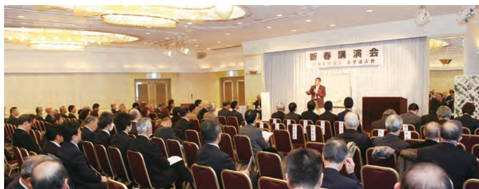
大雪に見舞われたこの日。足下の悪い中、多くの皆様においでいただきました。

では、その術とはどのようなものなのだろうか。氏は「人生で、経営で、成功するために何が必要なのか?」ということに対して、「①夢、②戦略、③感謝」の3つのポイントを大切なこととしている。この3つのポイントはあまりにも当たり前のこと過ぎて、ついつい忘れがちになるものでもある。まず最初に「夢」。これは人生や仕事での目標を設定し、それをどのようにして実現させるか。そこには経営に対する使命や決意等も含まれるでしょう。まさに経営戦略の根本に位置するものです。次に「戦略」。経営の場合、自分との戦いの他に顧客や他店との関係が生じてくる。そこで氏は、①商品戦略(1位を目指す商品)②地域戦略(1位を目指す地域)③客層戦略(1位を目指す客層)④営業戦略(どのように新規開拓するか)⑤顧客戦略(リピート・紹介の方法)⑥組織戦略(組織・社員に対しどのように活性化させるか)⑦財務戦略(いかに節約・倹約するか)⑧時間戦略(事業主は趣味を捨て夜討ち朝駆けの気持ちで向かう)⑨やる気戦略(やる気を出し、それを維持する)という9つを挙げ全体の戦略と現場の戦術の重要性を示していた。最後に「感謝」。