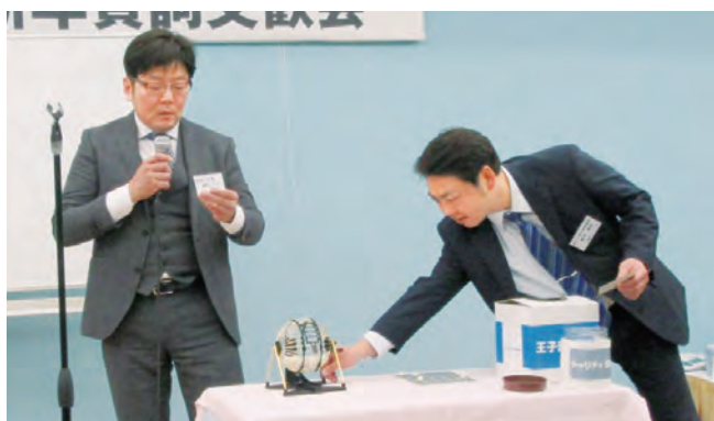
恒例のチャリティービンゴ