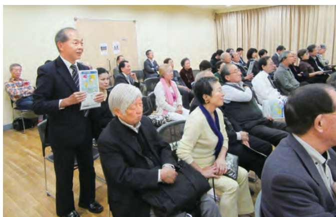
熱心に聞き入るご参加の皆様

体の中の各細胞が常に新しい細胞に入れ替わっていると共に、細胞の中の要らなくなったタンパク質がオートファジー(自食作用)によって常にリサイクルされている事をプロジェクターを用いて科学初心者にもわかる様に講演して頂きました。