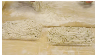
美味しいおそばの完成です。

約2時間の講習会も、あっという間に過ぎ、最後に店主が打った美味しい二八蕎麦を頂きました。体験された皆様の蕎麦も別格なお味でしたでしょうか?