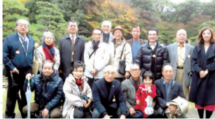
国宝建築に感動、圧倒されました。