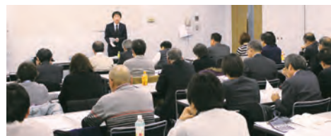
熱心に受講する皆様

講習会では、計算の連続で、複雑に数字がからみ、耳馴れない単語が幾つも出てきましたが、髙田講師のわかり易い説明(とは言え、電卓をたたくのが精一杯)で何とか、例題会社の1株の価額を割り出す事ができました。