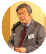
清水担当副会長の 挨拶