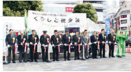
開会式のテープカット