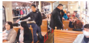
トロッコ列車にて