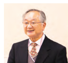
司会の飯野委員長

講習会は、株式会社サンプル(例題会社)の過去3期分の法人税(確定)申告書をもとに、1株当りの株式価額を割り出す方法でスタート致しました。