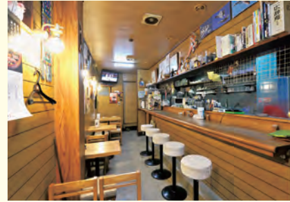
▲家庭的な空間にコーヒーのいい香りが漂う。