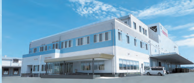
気仙沼食品建物外観