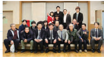
マジックを楽しんだひととき