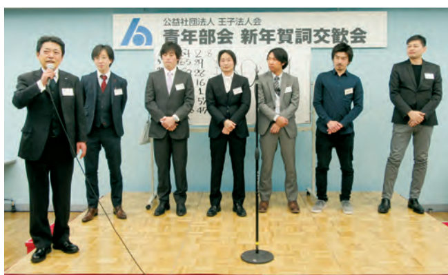
部会長の「仲間を増やす!」の想いが形に。