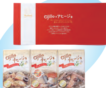
アヒージョセット

三陸の海の幸、サンマ、カツオ、サメなどの加工食品の製造を行います。徹底した衛生管理とともに商品開発にも力を注ぎ、第42回農林水産祭水産部門では「あぶりさんま」が天皇杯を受賞するなど、時代の嗜好を捉えた美味しく安全・安心な管理体制は高く評価をいただいております。