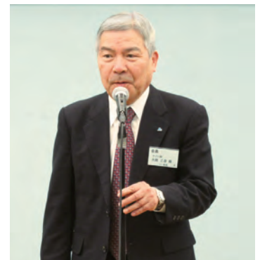
水越会長のごあいさつ