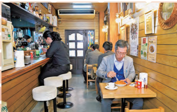
▲賑わうランチタイム

今回は十条篠原演芸場近くのアルカードさんにお邪魔しました。名前の「アルカード」とは、ドラキュラ(Dracula)の綴りをひっくり返したものです。ご主人が高校生のときに観た映画『ドラキュラ』の中で、ドラキュラが「アルカード」と名乗っていたのが気に入り、将来お店を継いだときに店名にしようと決めていたそうです。 昔ながらの喫茶店という言葉がピッタリ。地元で愛されているのがわかります。ランチのコーヒーも一杯ずつサイフォンで淹れるというこだわりよう。馥郁たる香りが店内を包み、ゆったりとした時間が流れます。こぢんまりとして居心地がよく、つつい長居をしてしまう、そんなお店です。 喫茶店でスパゲティといえばやっぱりナポリタン。こちらでも人気メニューのひとつで、どこか懐かしい、家庭的な味が評判です。ハンバーグやオムレツ、チキンソテーなど定食メニューも充実しています。ラストオーダーは22:30と遅く、残業でヘトヘトになっても、ご主人と奥様がいつでも温かく迎えてくれます。