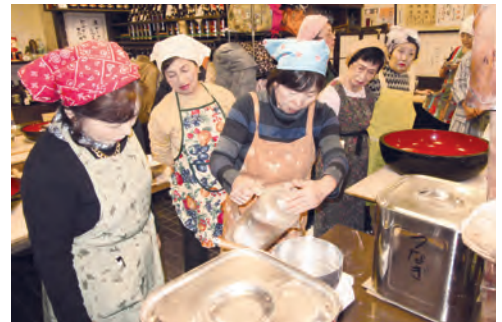
慎重に慎重に準備!