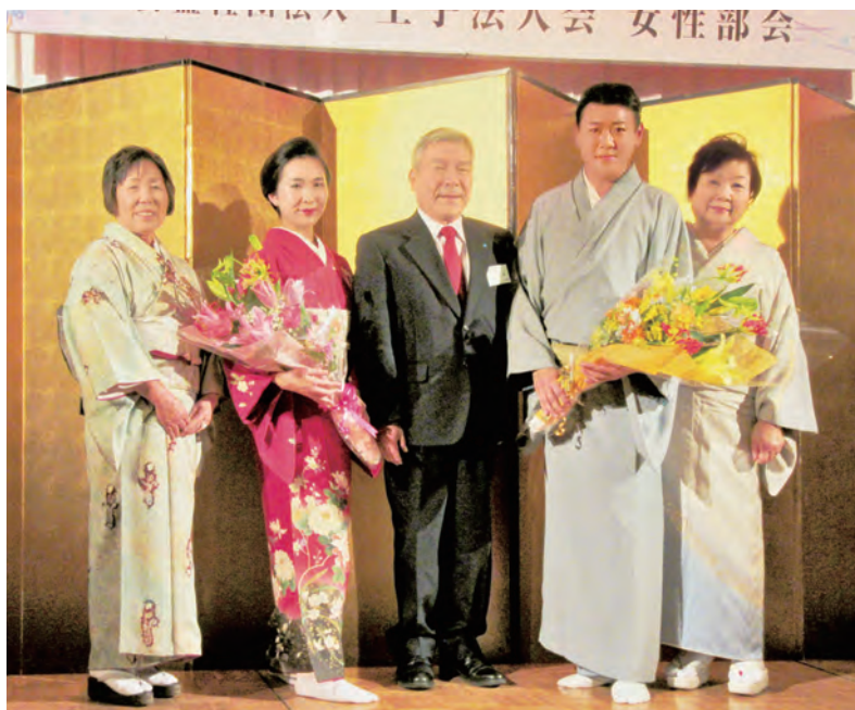
両先生を囲んで記念撮影