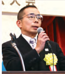
織田北都税事務所長