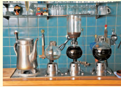
▲お店自慢のサイフォン