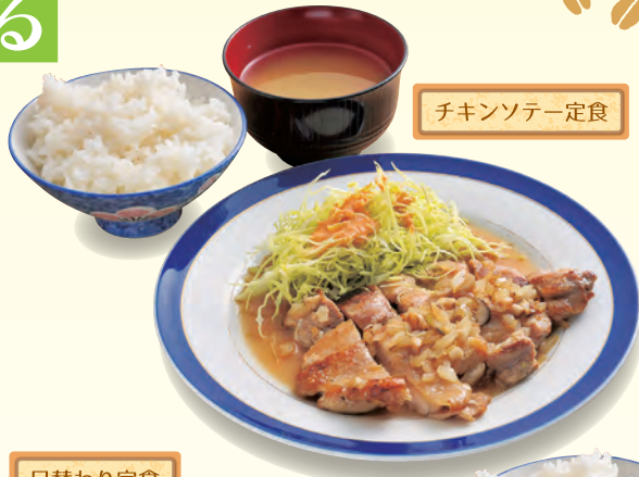
チキンソテー定食