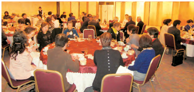
美味しい食事をたっぷり堪能されました。

足元の悪い中、多数出席頂き、有難うございました。今年も女性部会を宜しくお願い致します。