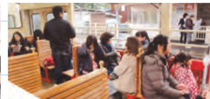
天気回復で視界良好