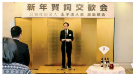
清水部会長の挨拶