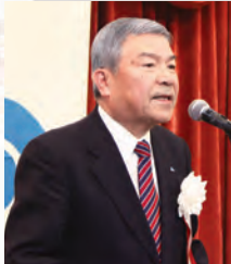
年頭の挨拶 水越会長