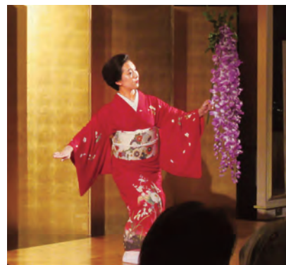
宗山流倭先生の藤娘