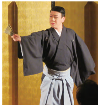
見事な黒田節の舞