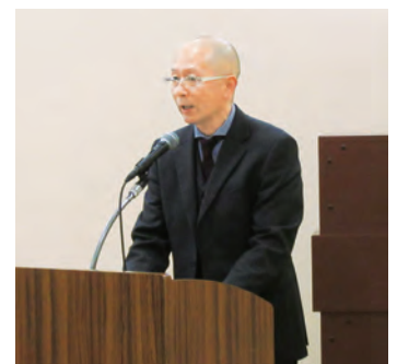
司会の関根副会長