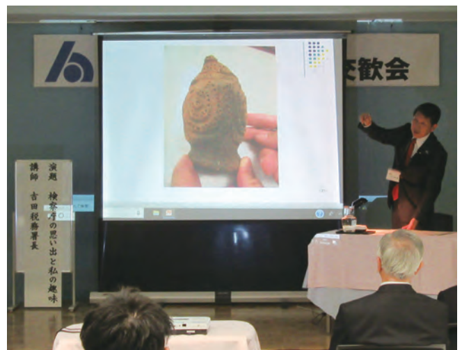
吉田署長の趣味は…