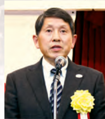
吉田王子税務署長