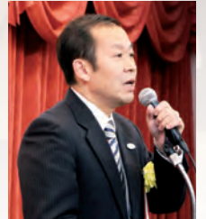
外石王子税務署副署長